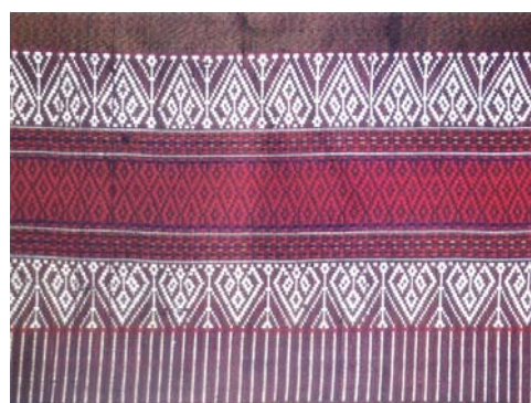
รูปที่ ๑ ตัวอย่างผ้าซิด (ข้อ ๒.๑)